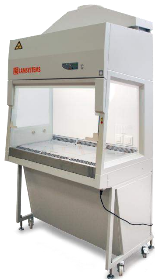
Класс II Тип B2