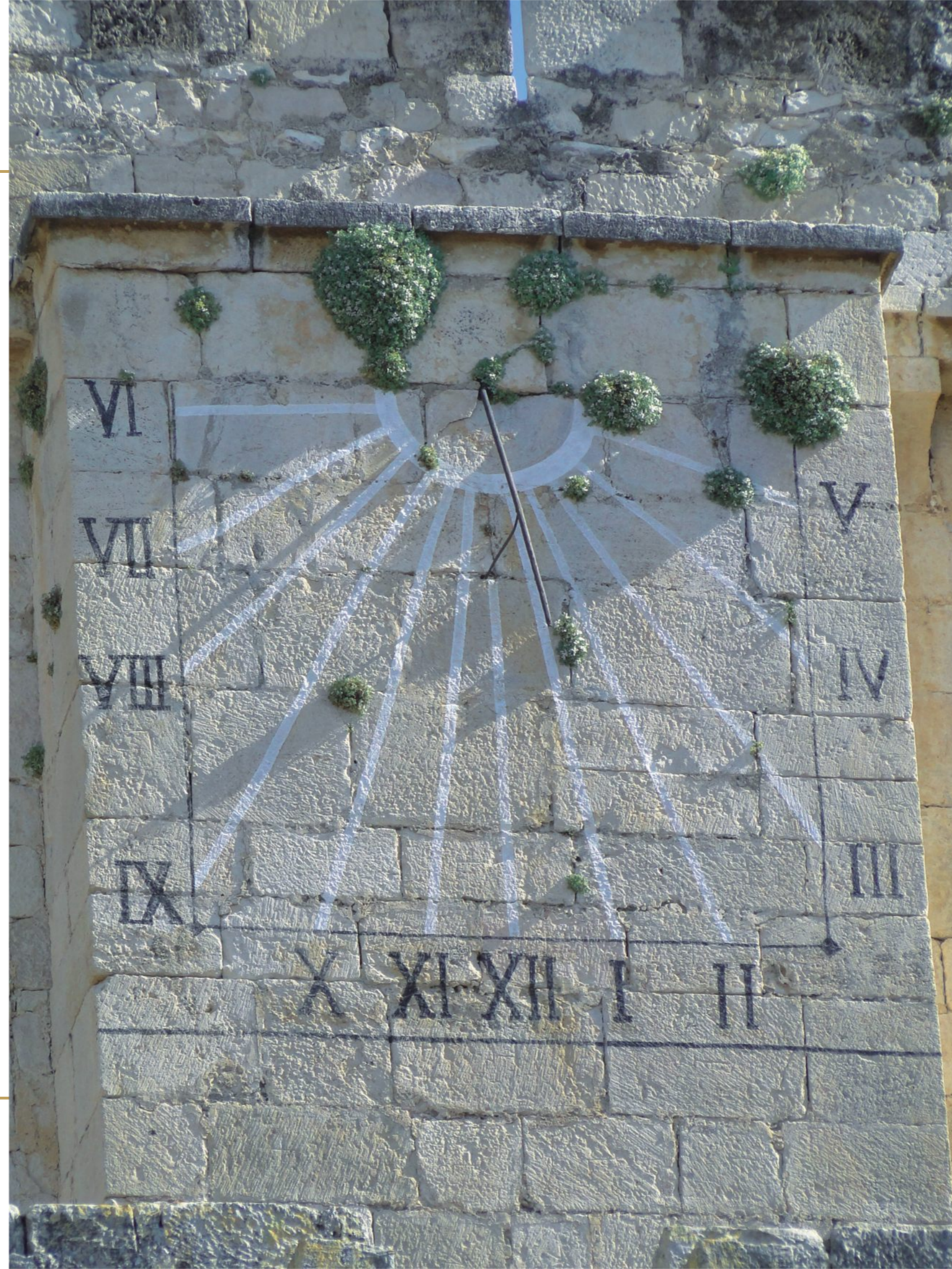
Испания. Цистерцианский монастырь святого креста. Солнечные часы. XII век.

Единственная причина для существования времени – чтобы все не случилось одновременно. А. Эйнштейн